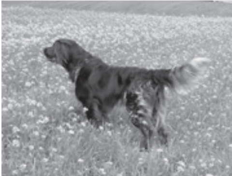
Hedeskov's Amigo 14324/2004

Den 17-8-07 brugsprøve ved Isenvad, 2. pr Den 22/23-10-07 fuldbrugsprøve på Fyn 1. pr. 1. vinder med 264 point