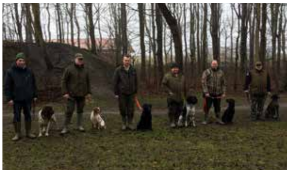
Deltager til dressurafslutning i Thy Mors