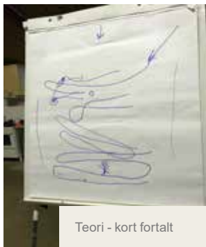
Teori - kort fortalt

Kurset, var forbeholdt nye hunde og nye hundeførere som havde fået mod på mere efter vinterens indendørs dressurtræning. I alt deltog 8 hunde og hundeførere i kurset, som derved var fuldtæget.