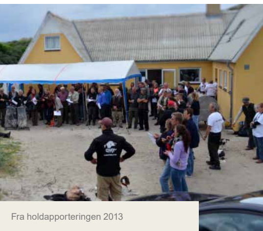
Fra holdapporteringer 2013