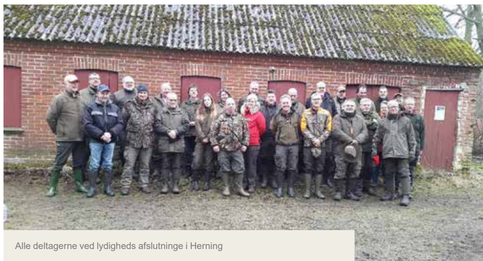
Alle deltagerne ved lydigheds afslutning i Herning