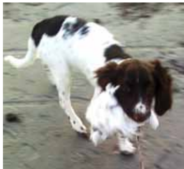
Min første måge

I slutningen af februar fandt jeg ud af, at det er sjovt at hente fugle. En dag da vi gik nede på Strandengen fandt jeg en død måge. Far og mor bliver altid glade når jeg kommer med et eller andet i munden, så jeg skyndte mig at samle den op, og løbe hen til mor med den. Hun roste mig og tog et fint billede af mig som hun straks sms-ede til far, så han også kunne se, at jeg havde "apporтерet" en rigtig fugl.