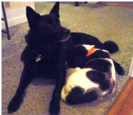
Beyla og mig, et par dage efter at jeg kom hjem. Hun er dejlig...

Mor tog mig straks med ud i haven, og så kom min nye storesøster og sagde hej. Hun hedder Beyla og er en sort spids. Dengang syntes jeg, at hun var lidt stor, men hun var sød ved mig og vi blev hurtigt gode venner. Beyla havde åbenbart hørt at jeg skulle komme, for hun havde fundet en bamse til mig, længe inden jeg flyttede ind. Hun havde passet godt på den, og puttet den rigtig godt til, så den duftede dejligt af hund. Den overtog jeg straks. Jeg har den stadig, og en gang imellem får hun lov at låne den et lille stykke tid.